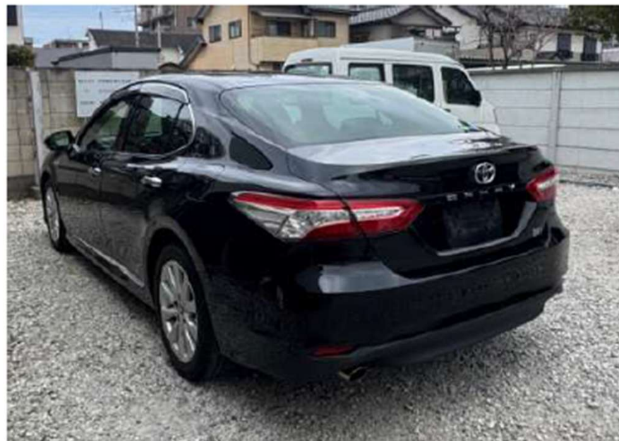
ボディカラー：アティチュードブラックマイカ(218)